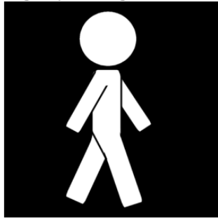
gå fysiologiskt rätt