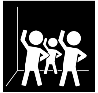
röra sig rytmiskt