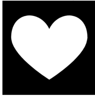
kännedom om puls